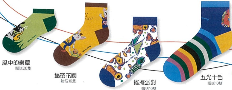
風中的樂章 贈送20雙