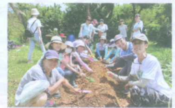
109年的三重低碳推廣中心「我很醜可是我很Natural」課程，在戶外講課並實際進行操作，由學員親自整地、種薑黃，並控窯煮食，推動食農教育。

2.美好的舊時光~大料坎溪的尋尋覓覓特展 (1)濕地故事館特展-美好的舊時光~大料坎溪的尋尋覓覓結合導覽解說後，前往戶外新海二期人工濕地實地參訪與生態解說，還有特展主題大地遊戲，提升民眾參與度，更可以在遊戲中認識河流及濕地的保育現況。 (2)活動全程免費，以網路報名方式為主，現場報名為輔，活動日前一週開放報名，每場次名額均限20位，額滿為止。 (3)於環境季期間參加活動者，另有神祕小禮物，數量有限贈完為止。 活動時間：4~6月，共計3場(暫定於每個月第三個週日辦理) 活動地點：濕地故事館特展室、新海二期人工濕地 3.地區低碳推廣中心課程串聯 新北市目前已成立21個地區低碳推廣中心，開設「營造低碳社區」課程，期能藉由環境教育的功能，將低碳生活的理念推廣至民眾並深耕於一般社區、鄰里及家戶，以自發性將節能減碳落實於日常生活當中。課程主軸包含「綠色交通」、「省電節能」、「資源再利用」及「低碳生活」等，想參加的家長與小朋友請先上網報名喔！