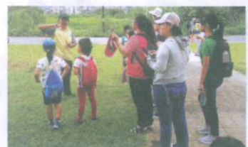
▼濕地故事館特展主題活動的戶外解說

2.美好的舊時光~大料坎溪的尋尋覓覓特展 (1)濕地故事館特展-美好的舊時光~大料坎溪的尋尋覓覓結合導覽解說後，前往戶外新海二期人工濕地實地參訪與生態解說，還有特展主題大地遊戲，提升民眾參與度，更可以在遊戲中認識河流及濕地的保育現況。 (2)活動全程免費，以網路報名方式為主，現場報名為輔，活動日前一週開放報名，每場次名額均限20位，額滿為止。 (3)於環境季期間參加活動者，另有神祕小禮物，數量有限贈完為止。 活動時間：4~6月，共計3場(暫定於每個月第三個週日辦理) 活動地點：濕地故事館特展室、新海二期人工濕地 3.地區低碳推廣中心課程串聯 新北市目前已成立21個地區低碳推廣中心，開設「營造低碳社區」課程，期能藉由環境教育的功能，將低碳生活的理念推廣至民眾並深耕於一般社區、鄰里及家戶，以自發性將節能減碳落實於日常生活當中。課程主軸包含「綠色交通」、「省電節能」、「資源再利用」及「低碳生活」等，想參加的家長與小朋友請先上網報名喔！