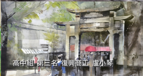
高中組 第三名 復興商工 盧小琴