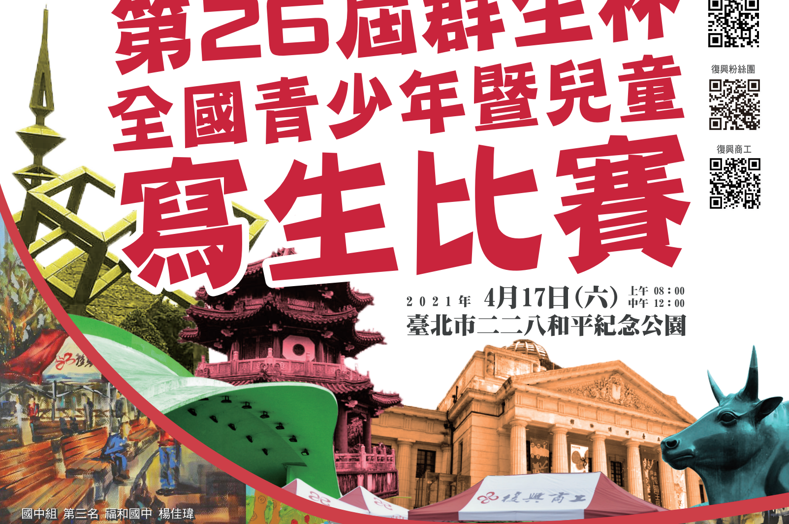
國中組 第三名 福和國中 楊佳瑋

2021年 4月17日(六) 上午 08:00 中午 12:00 臺北市二二八和平紀念公園