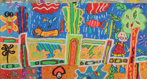
國小組 第一名 秀朗國小 蔡逸昕