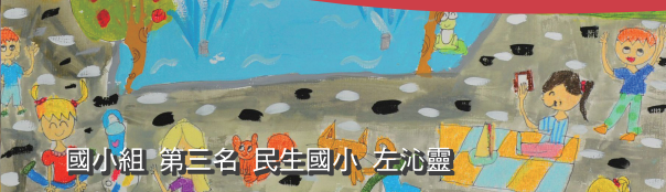
國小組 第三名 民生國小 左沁靈