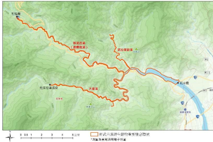
臺東縣海端鄉新武呂溪野生動物重要棲息環境範圍圖