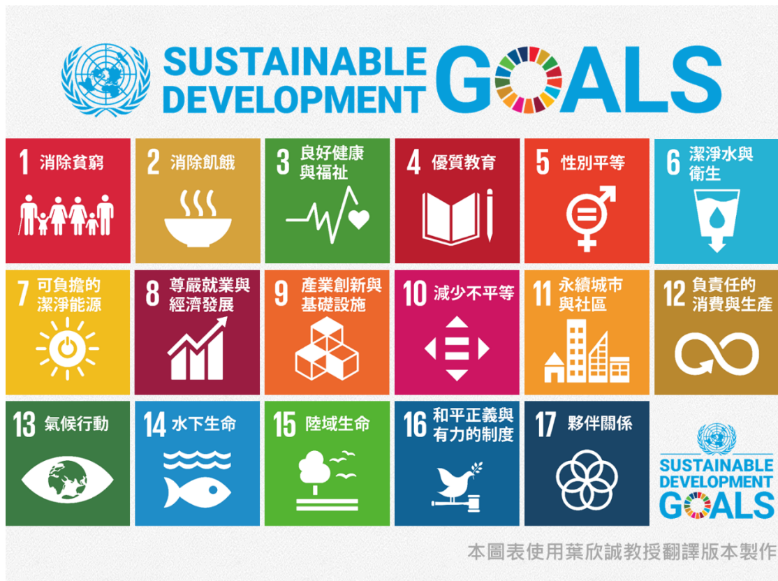
圖 2 聯合國 2030 年永續發展目標