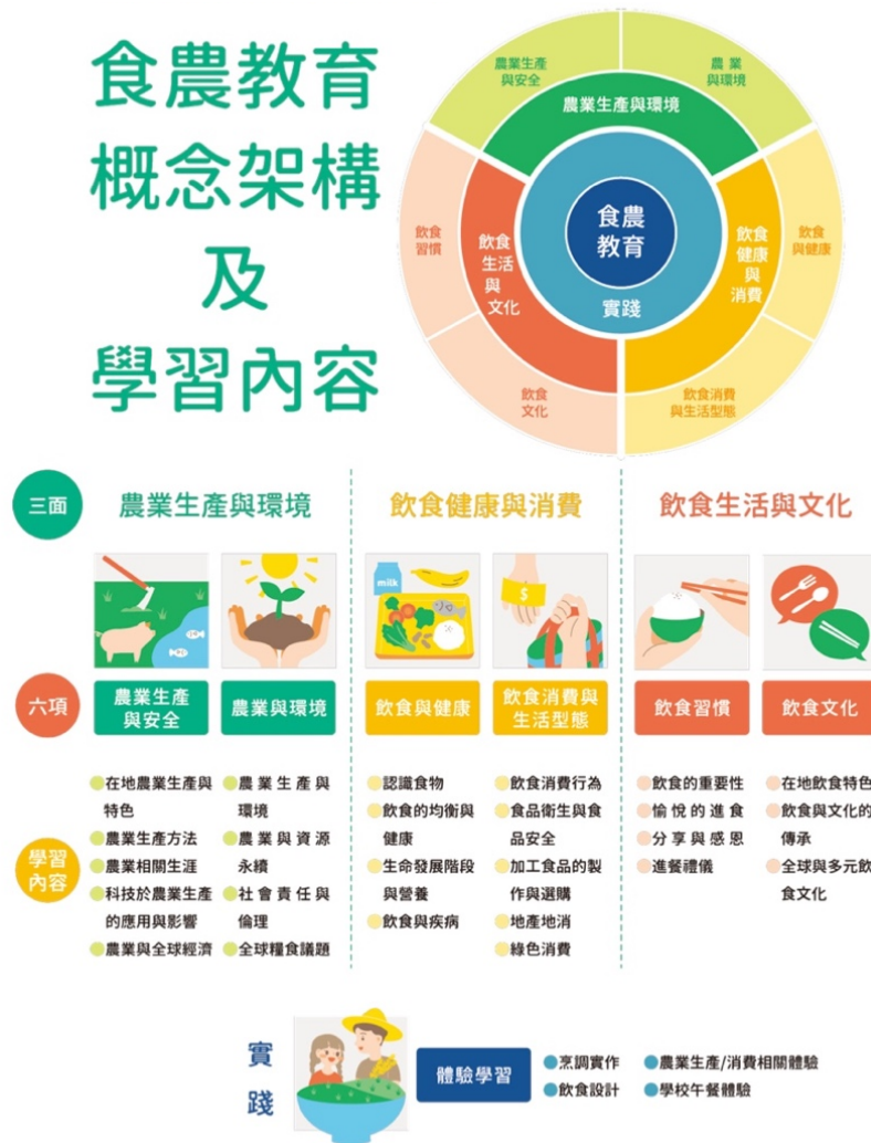
圖 1 食農教育 ABC 模式：食農教育三面六項