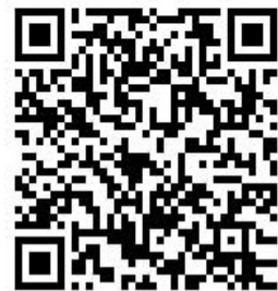
(詳細進度表、介紹影片)